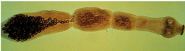
Fünfgliedriger Fuchsbandwurm mit Saugnäpfen am Kopf

In einem Fuchs können bis zu 200.000 Bandwürmer leben. Befallene Tiere scheiden mit dem Kot Bandwurmglieder aus, in denen einige 100 Bandwurmeier enthalten sind.